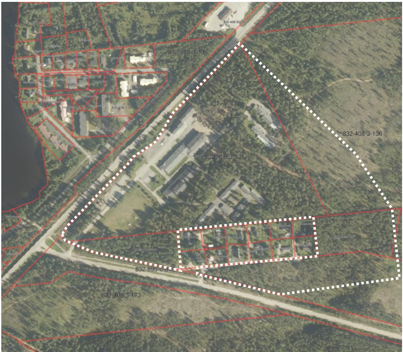
Suunnittelualan alustava rajausta

Suunnitelmassa kerrotaan maankäyttö- ja rakennuslain 63 §:n mukaisesti, miten osallistuminen ja vuorovaikutus sekä kaavan vaikutusten arviointi tapahtuvat kaavaprosessissa.